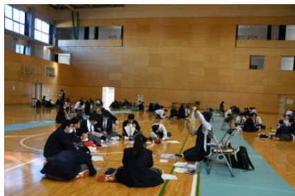
【メインアリーナ会場 進路ガイダンス】

生徒一人一人が興味のある職業についての理解を深め、自己の適性や能力を生かした的確な進路選択ができるように役立てる。今回は、進学や就職を問わず、職業別の分科会を実施しました。外部より約40名の講師が来校し丁寧に説明していただきました。2年後の希望する進路実現に向けて最善を尽くそう。